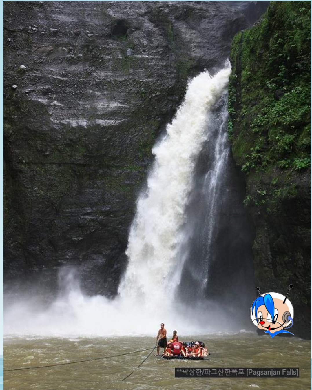
**파상한/파그산한폭포 [Pagsanjan Falls]

세계 7대 절경에 속하며 필리핀의 대표적인 관광지다. 영화 <지옥의 묵시록>과 <플래툰>의 촬영지였던 곳으로 스릴 만점의 급류타기를 즐길 수 있다. 이곳의 정식 명칭은 마그다피오(Magdapio) 폭포다. 파상한 강은 이곳에서 가장 큰 폭포를 가리키는 말이다. 이곳에 가려면 '방카'라는 통나무배를 타고 가야하며 이 배는 배에 탄 사람의 순수한 힘만으로 밀고 가야 한다. 약 1시간 정도 거슬러 올라가면 파상한을 만날 수 있다. 필리핀 사람들은 여자아이를 선호하는 경향이 있는데, 이 파상한 폭포수를 맞으면 딸을 낳는다는 미신이 있어서 현지인들도 많이 찾는다.